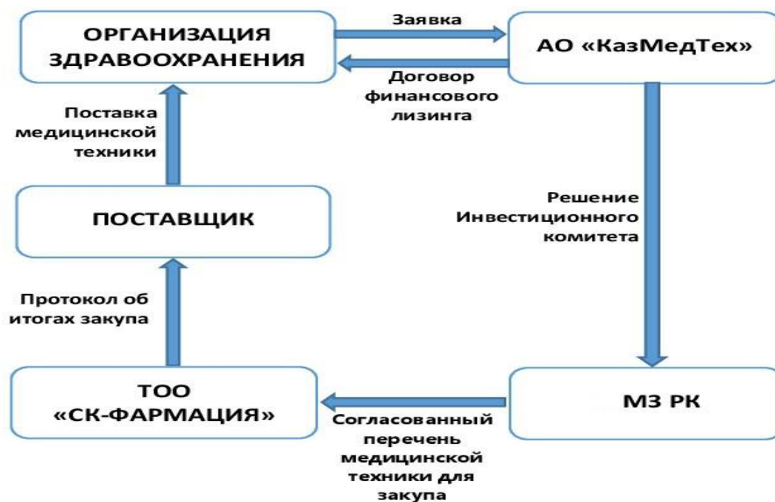
Рисунок 9 – Механизм лизинга для государственных организаций здравоохранения

Как видно из рисунка 9 в лизинговой сделке для государственных организаций здравоохранения участвуют пять сторон. Это АО «КазТехМед», организация здравоохранения, поставщик, министерство здравоохранения и ТОО «СК-Фармация».