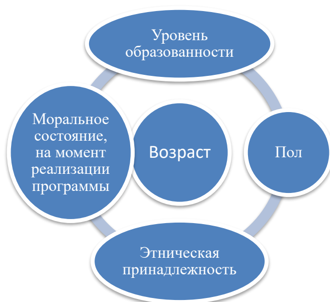
Рисунок 2. - Факторы, влияющие на восприятие анимационной программы

нескольких факторов, которые представлены на рис. 1.